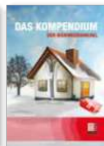
Das Kompendium. L'essentiel de l'isolation par l'extérieur.

HECK Wall Systems GmbH Thölauer Straße 25 | 95615 Marktredwitz Germany Tel.: +49 9231 802-0 Fax: +49 9231 802-330 www.wall-systems.com