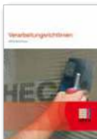
MISE EN ŒUVRE

Vous trouverez des informations et des solutions judicieuses de nos spécialistes de Heck MultiTherm